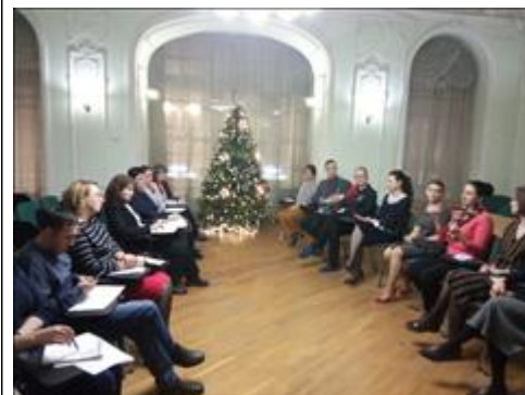
Группа №4 Группа №4 по обучению циклу семинаров по применению медиации и медиативных технологий на площадке ИМЦ Центрального района Санкт-Петербурга. 24.12.2019 г.

Электронные версии материалов (бюллетеней, брошюр, буклетов, газет, докладов, журналов, книг, презентаций, сборников и иных), созданных с использованием гранта в отчетном периоде (при условии, что такие материалы не содержатся в материалах, указанных в подпункте 5 настоящего пункта)