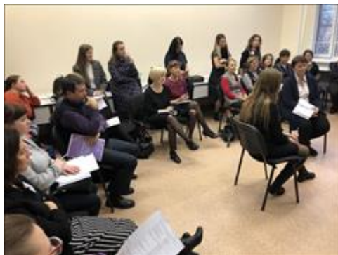
Группа №3 Группа №3 по обучению циклу семинаров по применению медиации и медиативных технологий на площадке Информационно-методического центра Московского района Санкт-Петербурга. 22.10.2019 г.