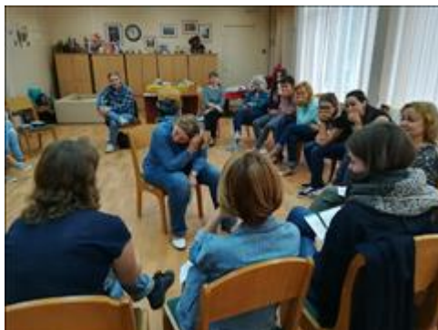
Группа №1 Группа №1 по обучению циклу семинаров по применению медиации и медиативных технологий на площадке школы №384 Кировского района Санкт-Петербурга. 28.08.2019 г.