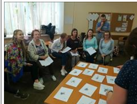
Группа №1 Группа №1 по обучению циклу семинаров по применению медиации и медиативных технологий на площадке школы №384 Кировского района Санкт-Петербурга. 29.08.2019 г.