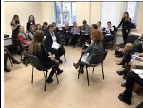
Группа №3 Группа №3 по обучению циклу семинаров по применению медиации и медиативных технологий на площадке Информационно-методического центра Московского района Санкт-Петербурга. 22.10.2019 г.