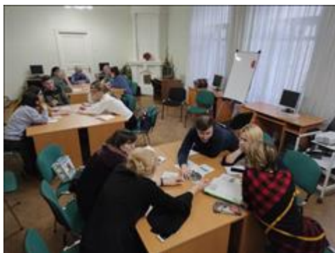
Группа №4 Группа №4 по обучению циклу семинаров по применению медиации и медиативных технологий на площадке ИМЦ Центрального района Санкт-Петербурга. 10.12.2019 г.