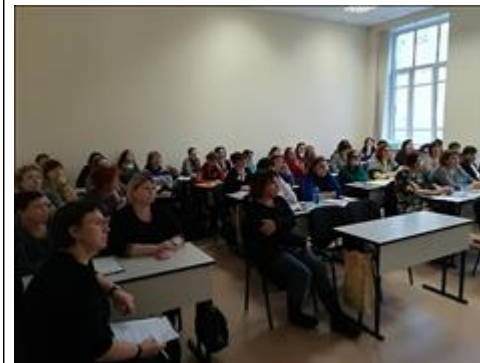
Второй день конференции Команда проекта рассказывает участникам конференции о нормативно-правовых аспектах применения медиации в учреждениях системы образования и специфике медиации между сверстниками (несовершеннолетними). 19.09.2019 г.