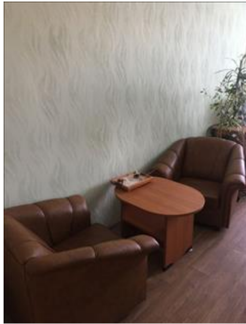
Центр примирения Курортного района 2 Помещение по адресу: Санкт-Петербург, г.Сестрорецк, Приморское шоссе, д.280 - ЦППМСП Курортного района Санкт-Петербурга (партнер проекта)