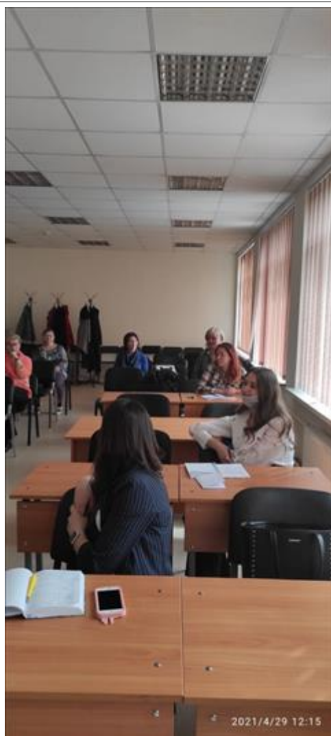
Очный семинар в Калининском районе 4 Семинар в Калининском районе 29.04.2021 г. Первая группа 11:00-14:00. Адрес: Санкт-Петербург, пр.Науки, д.24/3