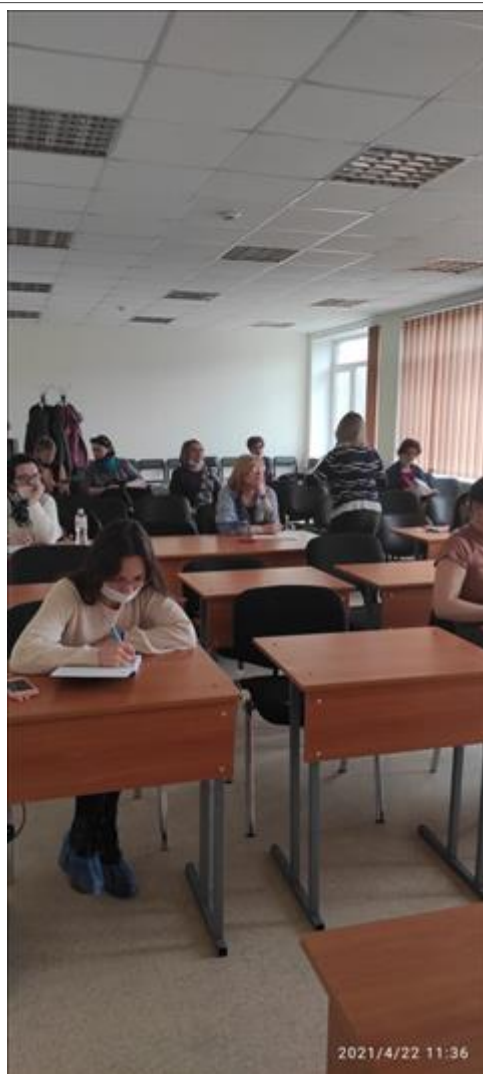
Очный семинар в Калининском районе 2 Семинар в Калининском районе 22.04.2021 г. Первая группа 11:00-14:00. Адрес: Санкт-Петербург, пр.Науки, д.24/3