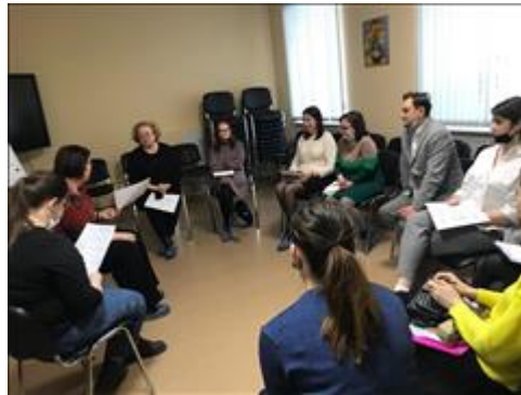
Очный семинар в Петроградском районе 1 Семинар в Петроградском районе 28.04.2021 г. Адрес: Санкт-Петербург, ул.Воскова, д.9-11