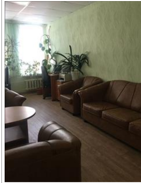
Центр примирения Курортного района 1 Помещение по адресу: Санкт-Петербург, г.Сестрорецк, Приморское шоссе, д.280 - ЦППМСП Курортного района Санкт-Петербурга (партнер проекта)