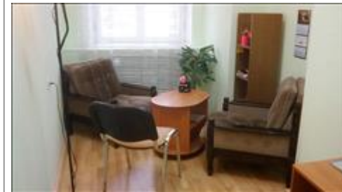
Центр примирения Адмиралтейского района 2 Помещение по адресу: Санкт-Петербург, ул.Садовая, д.50ББ - ЦППС Адмиралтейского района (партнер проекта)

Мероприятие: Проведение 9 очных семинаров по применению медиации в разрешении конфликтов целевой группы. Санкт-Петербург (ППЦ Петроградского района, ЦППМСП Курортного района, ЦППС Адмиралтейского района, ЦППМСП