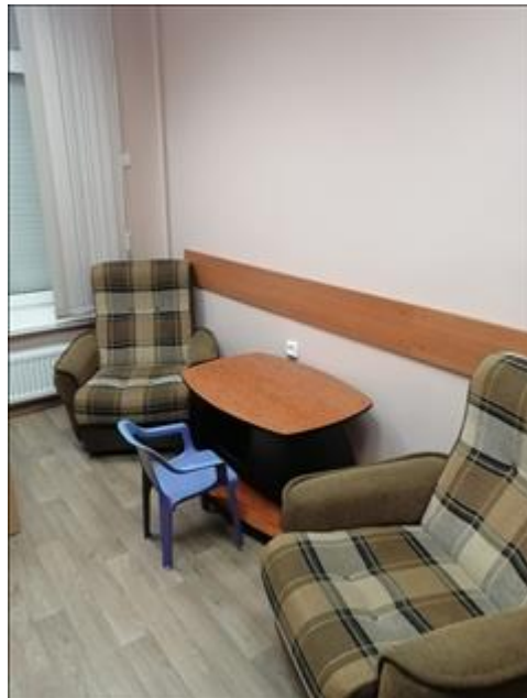
Центр примирения Калининского района 3 Помещение по адресу: Санкт-Петербург, пр.Науки, д.24/3 - ЦППМСП Калининского района Санкт-Петербурга (партнер проекта)