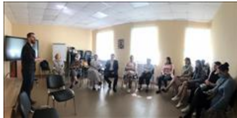
Очный семинар в Петроградском районе 3 Семинар в Петроградском районе 19.05.2021 г. Адрес: Санкт-Петербург, ул.Воскова, д.9-11