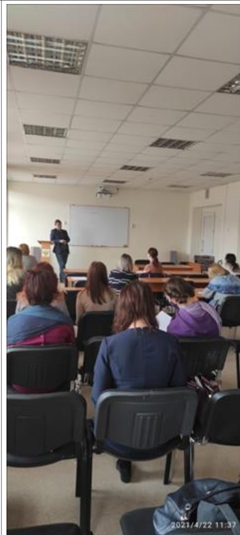
Очный семинар в Калининском районе 1 Семинар в Калининском районе 22.04.2021 г. Первая группа 11:00-14:00. Адрес: Санкт-Петербург, пр.Науки, д.24/3