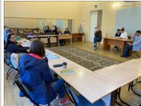
Очный семинар в Адмиралтейском районе 1 Семинар в Адмиралтейском районе 23.04.2021 г. Первая группа. 15:00-18:00