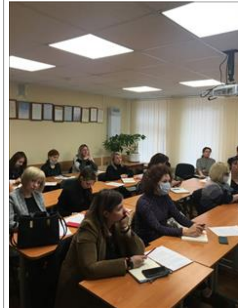
Очный семинар в Курортном районе 1 Семинар в Курортном районе 26.04.2021 г. Адрес: Санкт-Петербург, г.Сестрорецк, Приморское шоссе, д.280