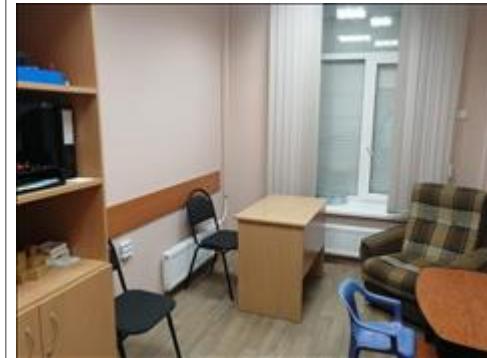
Центр примирения Калининского района 2 Помещение по адресу: Санкт-Петербург, пр.Науки, д.24/3 - ЦППМСП Калининского района Санкт-Петербурга (партнер проекта)