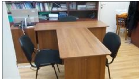
Центр примирения Адмиралтейского района 1 Помещение по адресу: Санкт-Петербург, ул.Садовая, д.50ББ - ЦППС Адмиралтейского района (партнер проекта)