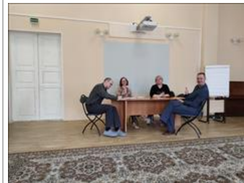
Учебная медиация на занятиях в Адмиралтейском районе Проведение слушателями учебной медиации на занятиях в Адмиралтейском районе 21.05.2021 г.

https://vk.com/arbimed_grant - в данной группе хранятся записи дистанционных семинаров