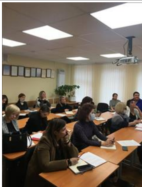
Очный семинар в Курортном районе 2 Семинар в Курортном районе 26.04.2021 г. Адрес: Санкт-Петербург, г.Сестрорецк, Приморское шоссе, д.280