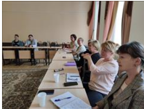
Очный семинар в Адмиралтейском районе 2 Семинар в Адмиралтейском районе 24.04.2021 г. Вторая группа: 15:00-18:00. Адрес: Санкт-Петербург, ул.Садовая, д. 50ББ

Мероприятие: Проведение приема представителей целевой группы профессиональными конфликтологами-медиаторами на площадке 4х центров примирения. Санкт-Петербург (ППЦ Петроградского района, ЦППМСП Курортного района, ЦППС Адмиралтейского района, ЦППМСП Калининского района; при необходимости возможен выезд специалистов в учреждения указанных районов. Каждое из 118 учреждений прикрепляется к соответствующему центру примирения по территориальному принципу)