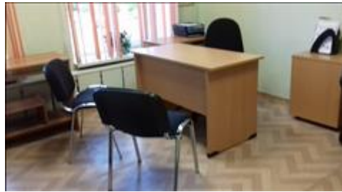
Центр примирения Калининского района 1 Помещение по адресу: Санкт-Петербург, ул.Обручевых, д.5 - филиал ЦППМСП Калининского района Санкт-Петербурга (партнер проекта)