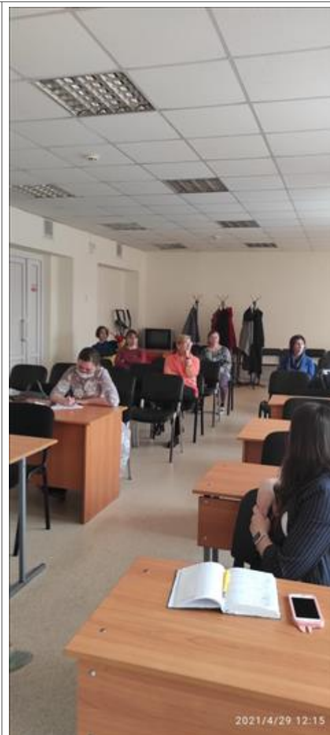
Очный семинар в Калининском районе 5 Семинар в Калининском районе 29.04.2021 г. Первая группа 11:00-14:00. Адрес: Санкт-Петербург, пр.Науки, д.24/3