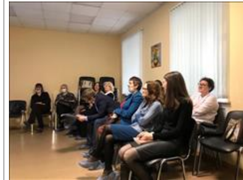
Очный семинар Петроградский район 2 Семинар в Петроградском районе 12.05.2021 г. Адрес: Санкт-Петербург, ул.Воскова, д.9-11